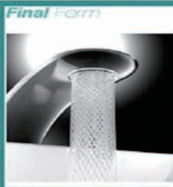
【漩涡水龙头】 连洗手都会变得很有意思