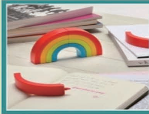
【彩虹马克笔】 给你的笔记本画上一道彩虹