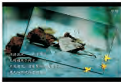
沟通不畅， 无所适从于内心。 只能清心， 唯有静思， 才能悟出沟通的 真谛。